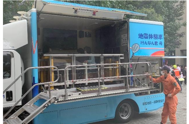
起震車で大地震を体験