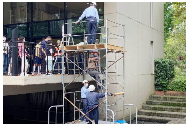
避難はしごの降下訓練