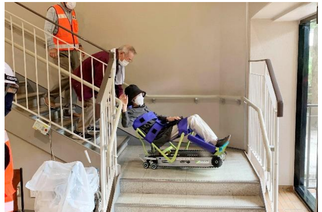
要救護者支援訓練