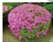
オオムラサキツツジ