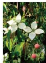
常緑ヤマボウシの花