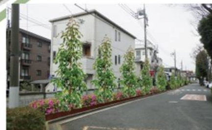
完成予想イメージ(外側オオムラサキ区間)