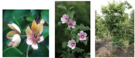
カラタネオガタマ