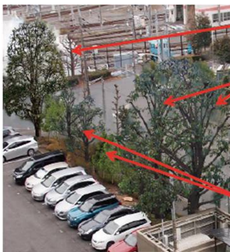
完成予想イメージ(西端部)

高木が伐採された跡に多様な低い木を新植し 自然林のイメージを持った植栽帯にします。