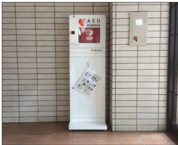
I棟1階 東側エントランスに設置